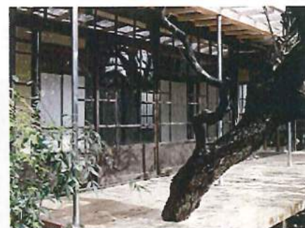
経営のリノベーション